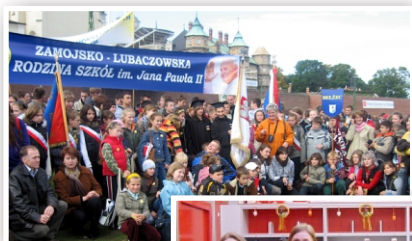
Spotkanie Rodziny Szkół im. Jana Pawła II na Jasnej Górze

Od 2011 roku współpracujemy z Wydziałem Politologii UMCS, w ramach której nasi uczniowie uczestniczą w warsztatach i prezentacjach multimedialnych prowadzonych przez kadrę naukową z Lublina.