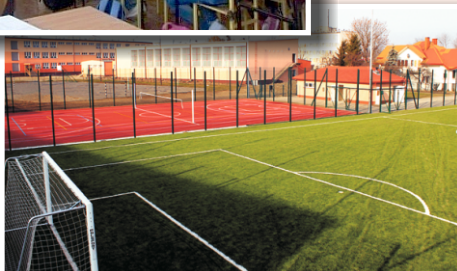
Kompleks boisk "Orlik 2012"