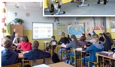
Lekcja z wykorzystaniem tablicy multimedialnej